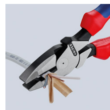
Продольное резание для разделения плоских кабелей