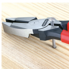
Область захвата под шарниром для мощного рычажного усилия